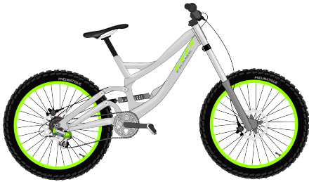
Vélo de montagne

Tu dois choisir avec quel vélos tu commenceras la course.