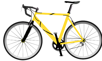
Vélo de route

Le deuxième vélo sera à un point de contrôle dans le parcours. Tu devras passer par ce point de contrôle.